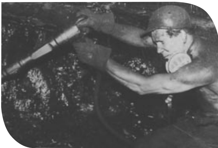
Ehrenamtlicher der Bergbauausstellung – vor 40 Jahren bei der Arbeit

Auch unter dem RheinRuhrZentrum wurde in bis zu 970 m Tiefe gearbeitet. Dort stand die Zeche Humboldt. Im RheinRuhrZentrum wird vom 12. bis zum 21. Oktober eine Ausstellung zur Bergbaugeschichte in Heißen stattfinden.