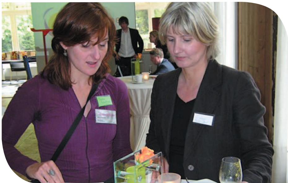
Exkursion mit Netzwerkpartnern nach Driebergen (NL) zur Vorbereitung des RUHRDAX o6